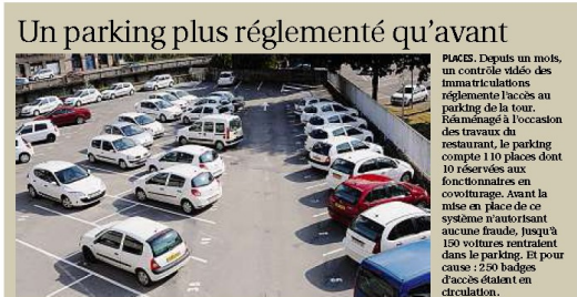
Un parking plus réglementé qu'avant PAGES. Depuis un mois, un contrôle vidéo des immatriculations réglemente l'accès au parking de la tour. Réaménagé à l'occasion des travaux du restaurant, le parking compte 110 places dont 10 réservées aux fonctionnaires en cow-riding. Avant la mise en place de ce système n'autorisant aucune fraude, jusqu'à 150 voitures entraient dans le parking. Et pour cause : 150 badges d'accès étaient en circulation.