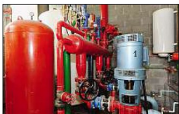
INCENDIE. Toujours au niveau m+1, un local abrite trois extincteurs pour les colonnes fumées. C'est là que les pompiers viennent se braver en cas d'incendie des étages. La tour possède deux réservoirs d'eau de 60 et 75 m 3 .