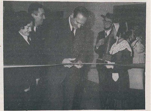
M. Chirac coupant le ruban symbolique à l'entrée de la cité administrative.