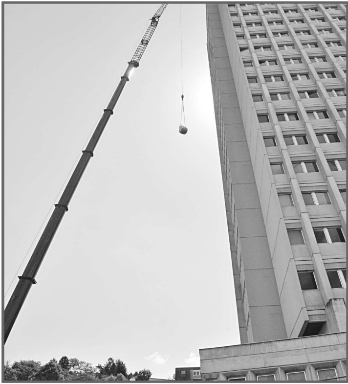
Un chantier qui déploie d'importants moyens de logistique sur le terrain.

Classée « Patrimoine du XXe siècle » en 2010, la tour administrative de Tulle inaugurée en 1973 par Jean Montalat et Jacques Chirac, est un des éléments architecturaux les plus réputés de la Corrèze. L'aspect « verrier » d'un bâtiment baignant au pied de la rivière est parfois décrié par les Tullistes eux-mêmes. La tour de 22 étages est pourtant typique de l'architecture des « Trente Glorieuses ».