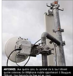
ANTENNES. Aux quatre coins du sommet de la tour résident quatre systèmes de téléphonie mobile appartenant à Bouygues, Télécom. Une demande de Free est en cours.