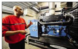
ÉLECTRICITÉ. En cas de coupure d'électricité, ce groupe électrogène 4x4 ou 6x6 assure le maintien de la tension. Il dispose d'une réserve de 2.000 litres. Il ne s'arrête jamais pendant la nuit.